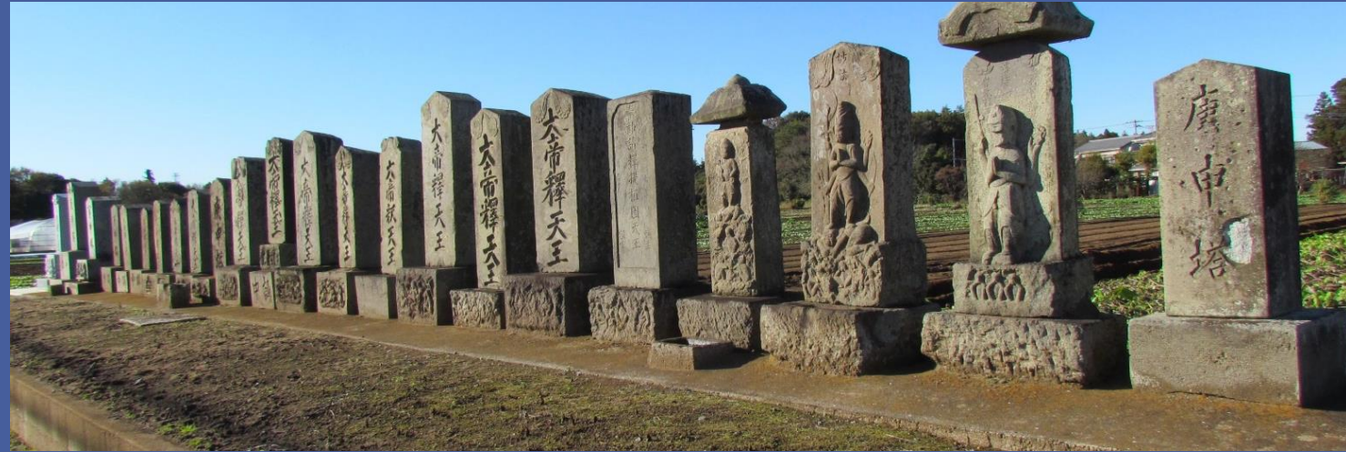
八千代市小池の庚申塚