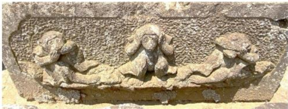
明治 6 年 (1873)