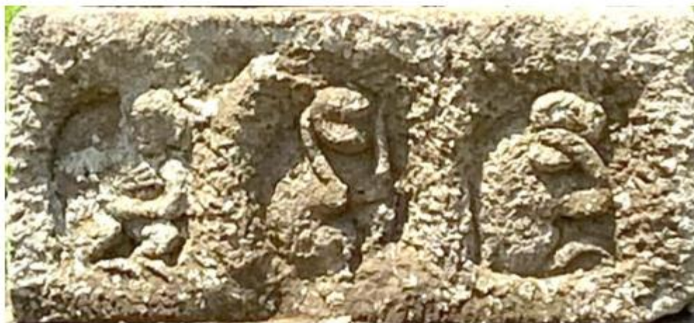
嘉永 4 年 (1851)