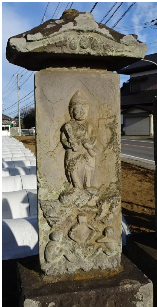
寛延3年(1750)佐山庚申塚