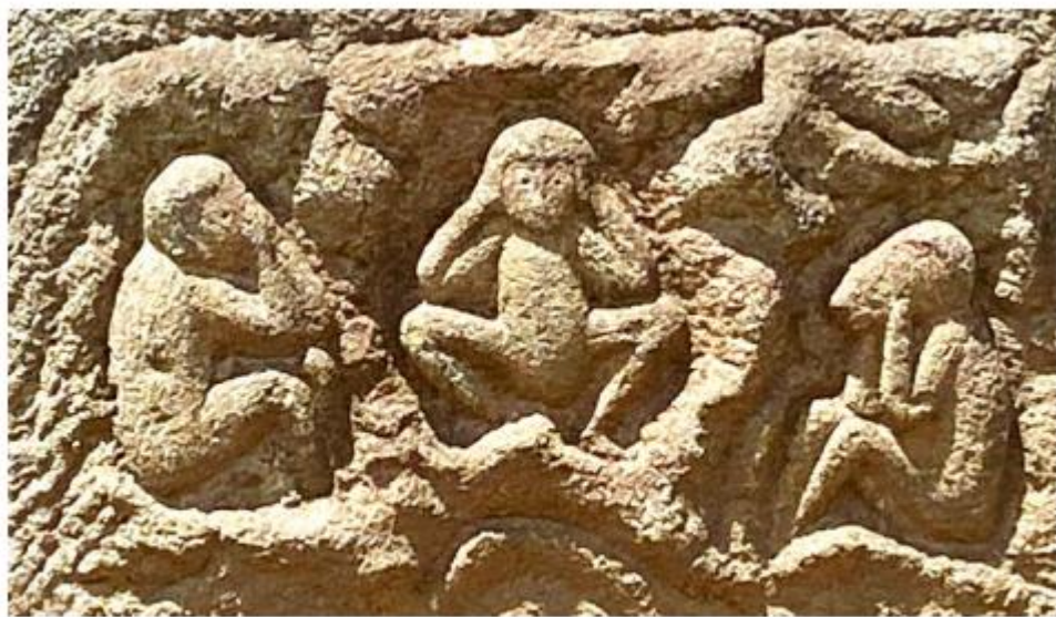
文化 12 年 (1815)