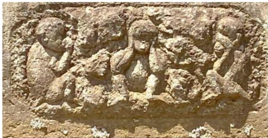
文久 2 年 (1862)