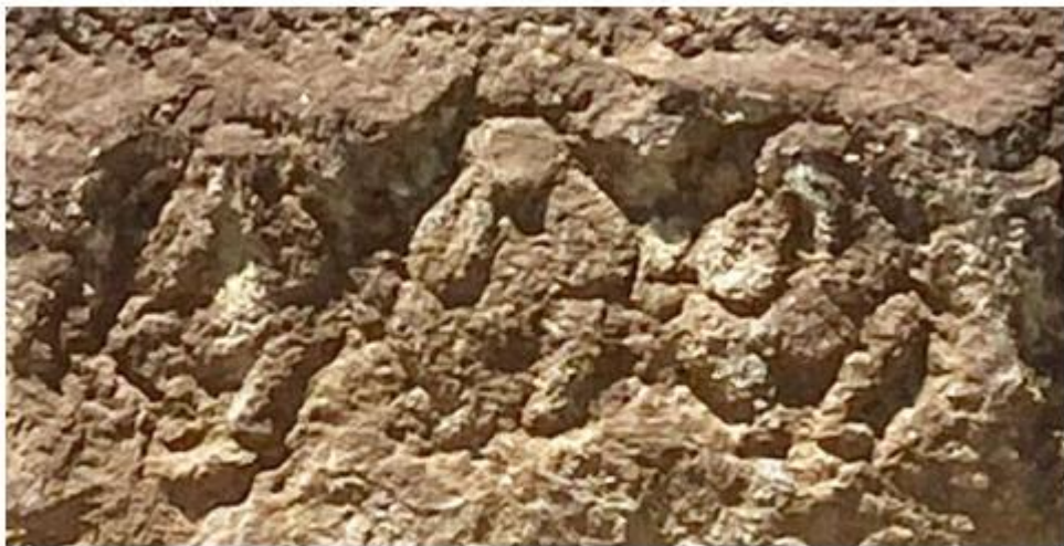
寛政 8 年 (1796)