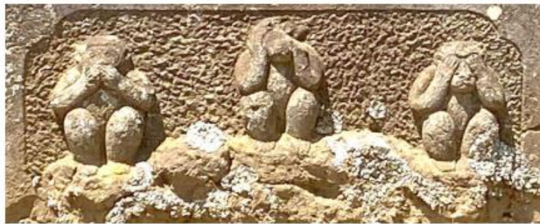
明治 13 年 (1880)