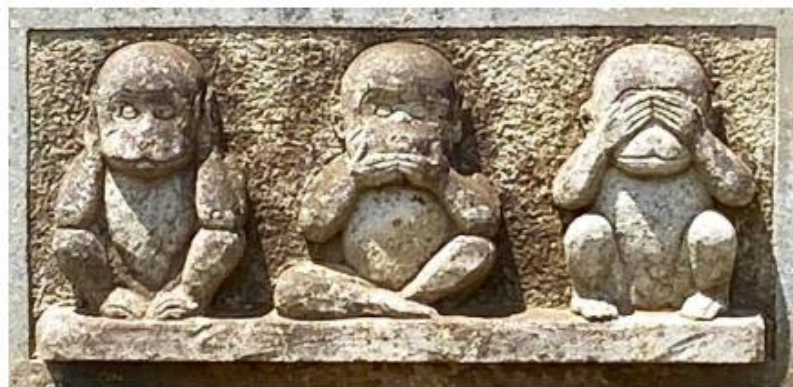
平成 3 年 (1991)