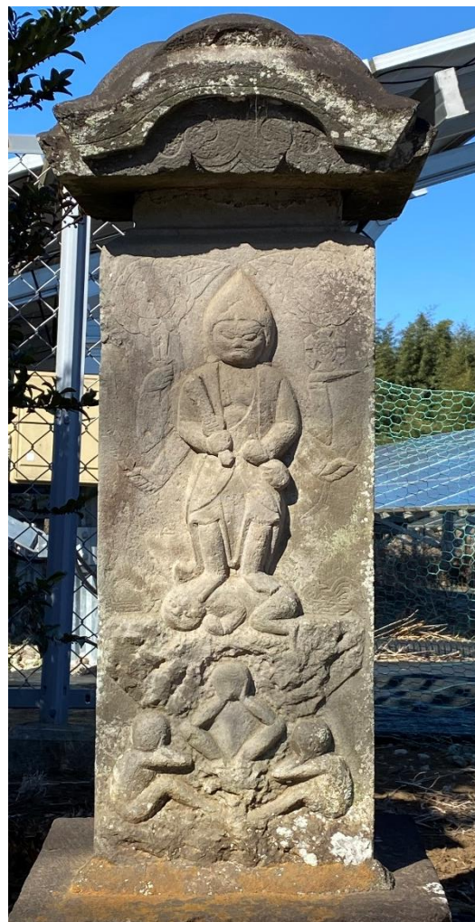
寛延3年(1750)真木野庚申塚