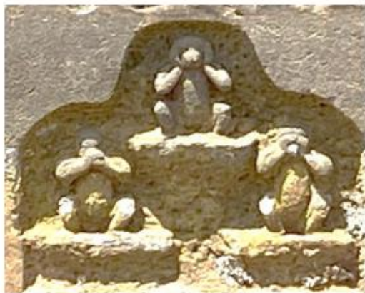
明治 32 年 (1899)