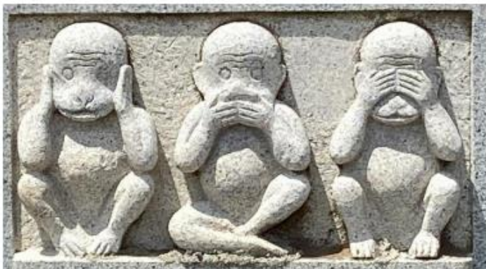
平成 22 年 (2010)