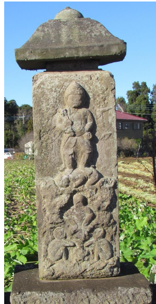
宝暦9年(1759)小池庚申塚