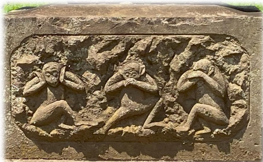
天保2年庚申塔の台石の三猿像