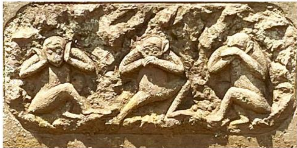
天保 2 年 (1831)