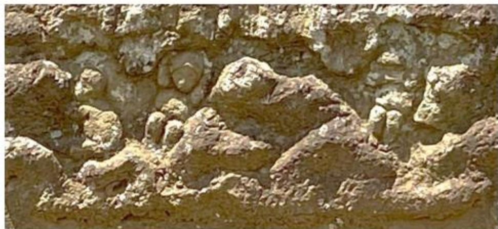
天保 11 年 (1840)