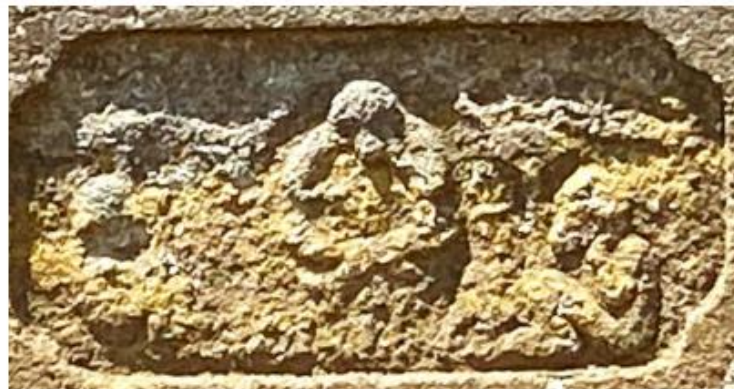
明治 20 年 (1887)