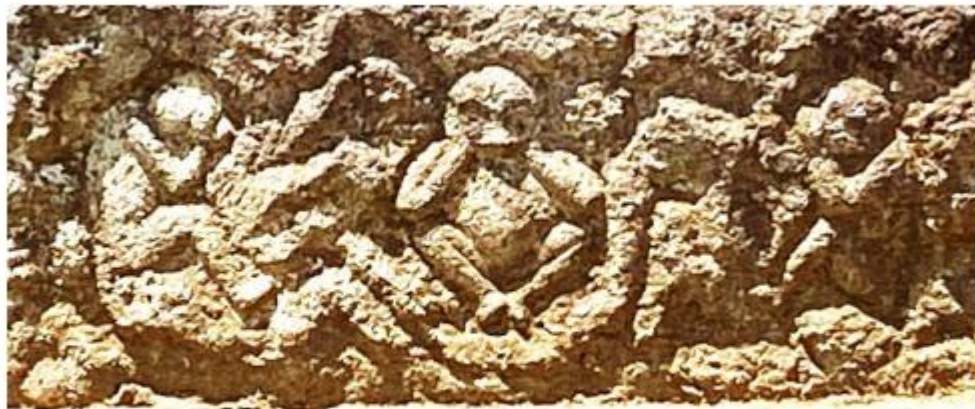
文化 4 年 (1807)