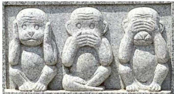
平成 31 年 (2019)