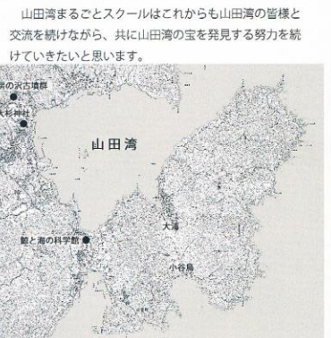
山田湾まるごとスクールはこれからも山田湾の皆様と交流を続けながら、共に山田湾の宝を発見する努力を続けていきたいと思います。

震災から7年が過ぎようとして、山田湾まるごとスクールも第5回を終えました。山田湾では防潮堤が建設され、高台移転が進み、仮設住宅が閉鎖されるなど、生活環境が目まぐるしく変化していると感じました。生活を再建するためにインフラの復興が第一なのは言うまでもないことですが、一方で「仮設では毎日のように顔を合わせていたのに、仮設を出たらあまり会うこともなくなつた」という声も聞かれました。心配されていた復興後の孤立化という次の課題も現実的になってきました。今回は、山田史談会、北浜老人クラブ、大浦小学校下仮設住宅の皆様と山田湾の「考古学」や「歴史」の話を共有することができました。これらの話題が少しでも日常に彩りをもち、明日の山田湾を考えるきっかけになれたら幸いです。