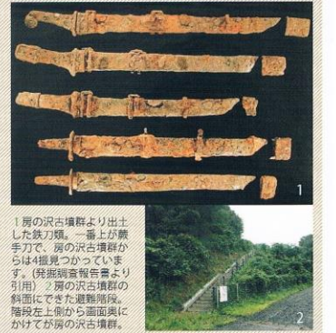
1房の沢古墳群より出土した鉄刀類。一番上が舞手刀で、房の沢古墳群からは4種類見ついています。(発掘調査報告書より引用) 2房の沢古墳群の斜面にできた遺構跡。階段を上ると古墳の墓石が並んでいます。

山田町沢田地区にある房の沢古墳群は丘陵の斜面を利用した古代蝦夷のお墓で、現在まで約30基の古墳が見つっています。古墳の中から古墳の刀とも呼ばれる、柄の部分の形状を模した古墳の刀が出土し、特に鉄刀類の多さは他の古墳群に類をみません。また壺などの馬具や馬の墓が4基見つかっており、房の沢古墳群の蝦夷たちが、馬と深くかかわっていた様子を窺い知ることができそうです。房の沢古墳群の東側の谷地と丘陵からは、住居跡と鉄生産遺跡(沢田遺跡)が確認されていることから、ここは墓・住居・鉄生産遺跡(工房)といった古代蝦夷の活動がまるごとわかる場所です。狭い範囲に縄文時代の活動全てがまとまっている房の沢から沢田一帯は、古代蝦夷の歴史を解明する上で貴重な場所だといえるでしょう。