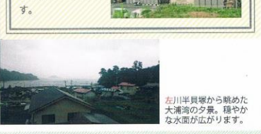
左川半島堤から眺めた大浦湾の夕景。穏やかな水面が広がります。

大浦小学校下仮設住宅には、大浦地区と小谷島地区で被災された46世帯の方々がお住まいでした。第2回まるごとスクール(2013年)で初めて訪問し、その暮らしぶりについてお話を伺いました。10Kという狭さに加えプライバシーがない生活は、大変なご苦労を伴ったことと推察します。震災から5年を過ぎた頃から徐々に転居される方が増え、2017年夏の時点で半数以上が空き家になっていました。2018年3月に完全に閉鎖される予定です。